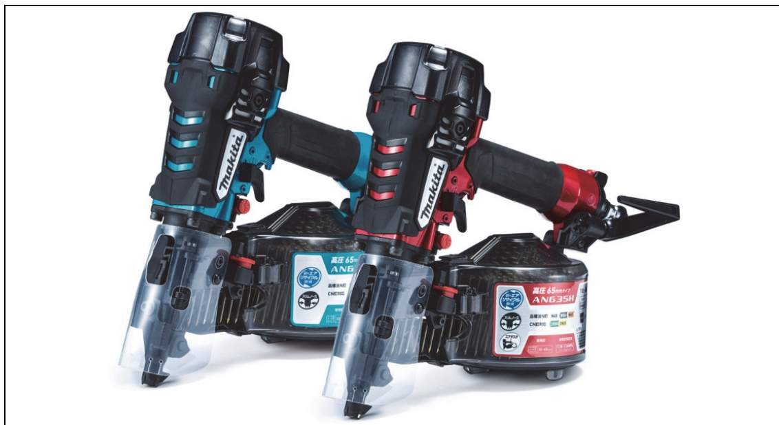
(左から)65mm高圧エア釘打 AN634HM/AN635H