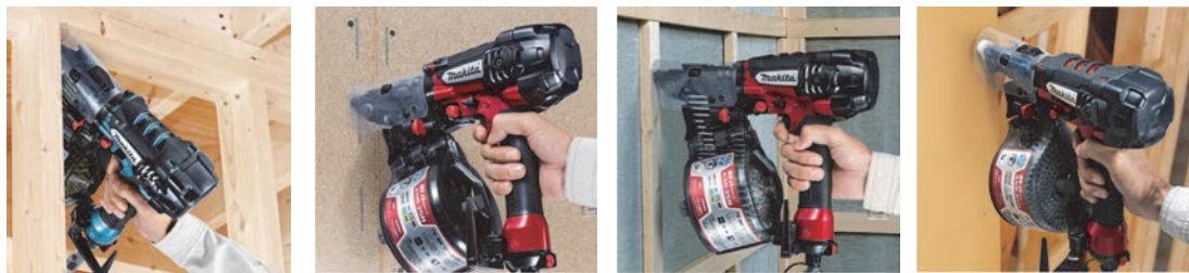
間柱のぬい打ちに 構造用合板への打込みに コンクリートへの打込みに 石こうボードに (ノーズアダプタS使用)

このたび発売するAN634H/AN635H(エアダスタ付)は、先端部に新しいスパイクスリムノーズを採用し、当社従来機に比べ、あらゆる傾斜角度でも滑りにくく、狙ったところへの確に打ち込みができるようになりました。