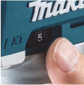
(1) 速度調整ダイヤル

作業内容に合わせて回転数を設定可能です。本機を握ったまま操作できる位置にダイヤルを配置しました。