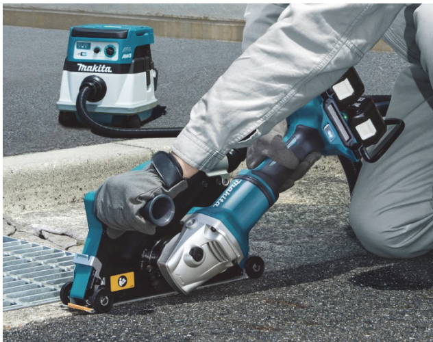
写真の集じん機・ダイヤモンドホイール用集じんカバー・ダイヤモンドホイールは別販売品です。

近年、現場の周辺環境やユーザーの健康への配慮から、建築・建設現場における粉じん対策がより強く求められています。当モデルは 2017 年 8 月に発売した 180mm 充電式グラインダ GA700D に、Bluetooth による集じん機との無線連動機能を追加したもので、コンクリートやレンガの切断作業現場などにおけるコードレス化をさらに進め、現場の粉じん対応強化と作業効率向上の両立に貢献します。