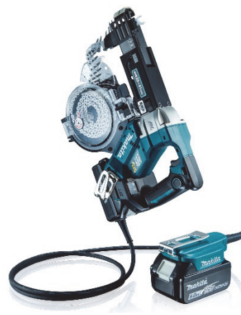
バッテリーアダプタ(別販売品:BAP18E)装着時