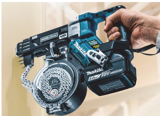
充電式オートパックスクリュードライバ FR451D

オートパックスクリュードライバは内装作業における、天井や壁に石膏ボード等を貼る作業に使用され、高い作業効率と取り回しの良さが求められます。このたび発売する製品は、マキタ 18V リチウムイオンバッテリーを使用、ハイパワーブラシレスモータを搭載し、充電式でありながら、AC 機同等の高速回転を可能にしました。ホースやコードを伴うエア機、AC 機に比べ、取り回し性が向上しています。さらに、バッテリーアダプタ(別販売品)を装着することで軽量化を実現しました。