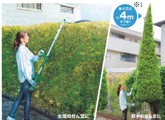
充電式ポールバリカン MUN300LD

株式会社マキタ(本社:愛知県安城市、取締役社長 後藤宗利、資本金 24,206 百万円)は、剛性のある竿の採用により最大約 3.0m まで竿が伸縮し、家周りの高い生垣や最大高さ約 4m ※1 までの庭木のせん定を軽快に行える「充電式ポールバリカン MUN300LD/301LD」を発売する運びとなりましたのでお知らせします。