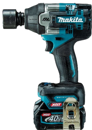
充電式インパクトレンチ TW007G