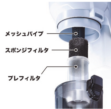
新・流路構造イメージ