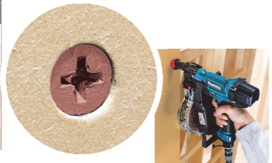
面一のキレイな仕上り

◎最適 ○打込み可能 ×打込み不可 木下地:SPF 鋼製下地:t0.6mm 石膏ボード:t12.5mm