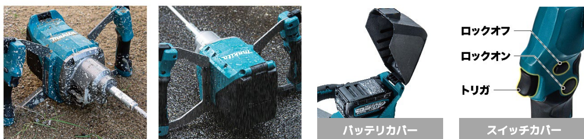
バッテリーカバー

IP56 の防じん・防水保護等級※2と、バッテリー、スイッチへのカクハン材の付着・固着を防ぐカバー※3により、ハードな現場でもしっかりと工具を保護します。