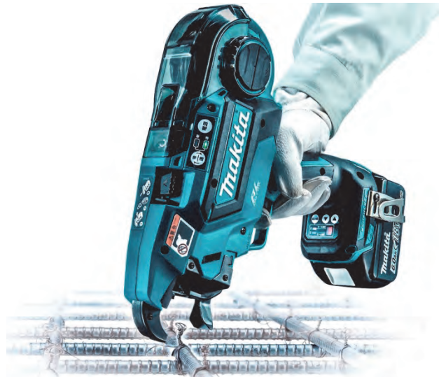
充電式鉄筋結束機 TR180D

このたび発売するTR180Dは、こうした作業を自動で行う当社初の充電式鉄筋結束機であり、誰でも素早く快適に鉄筋結束を行うことができます。当製品は14.4Vバッテリーでも使用可能で、また広い基礎工事現場などに最適な連続結束機能(連発モード)も搭載しています。