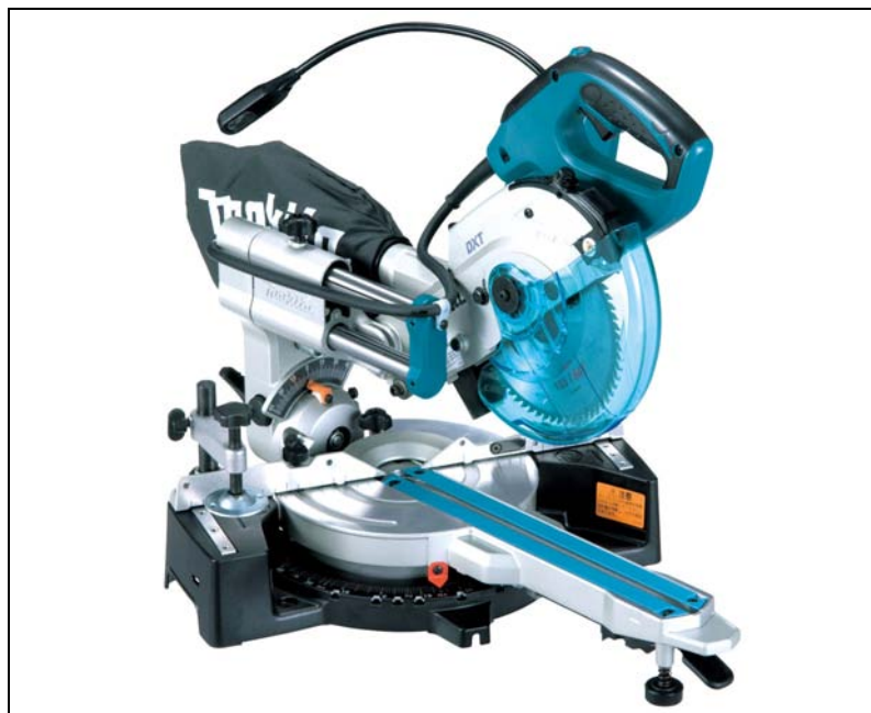
165mm スライドマルノコ LS0612FL (レーザー・LEDライト付)