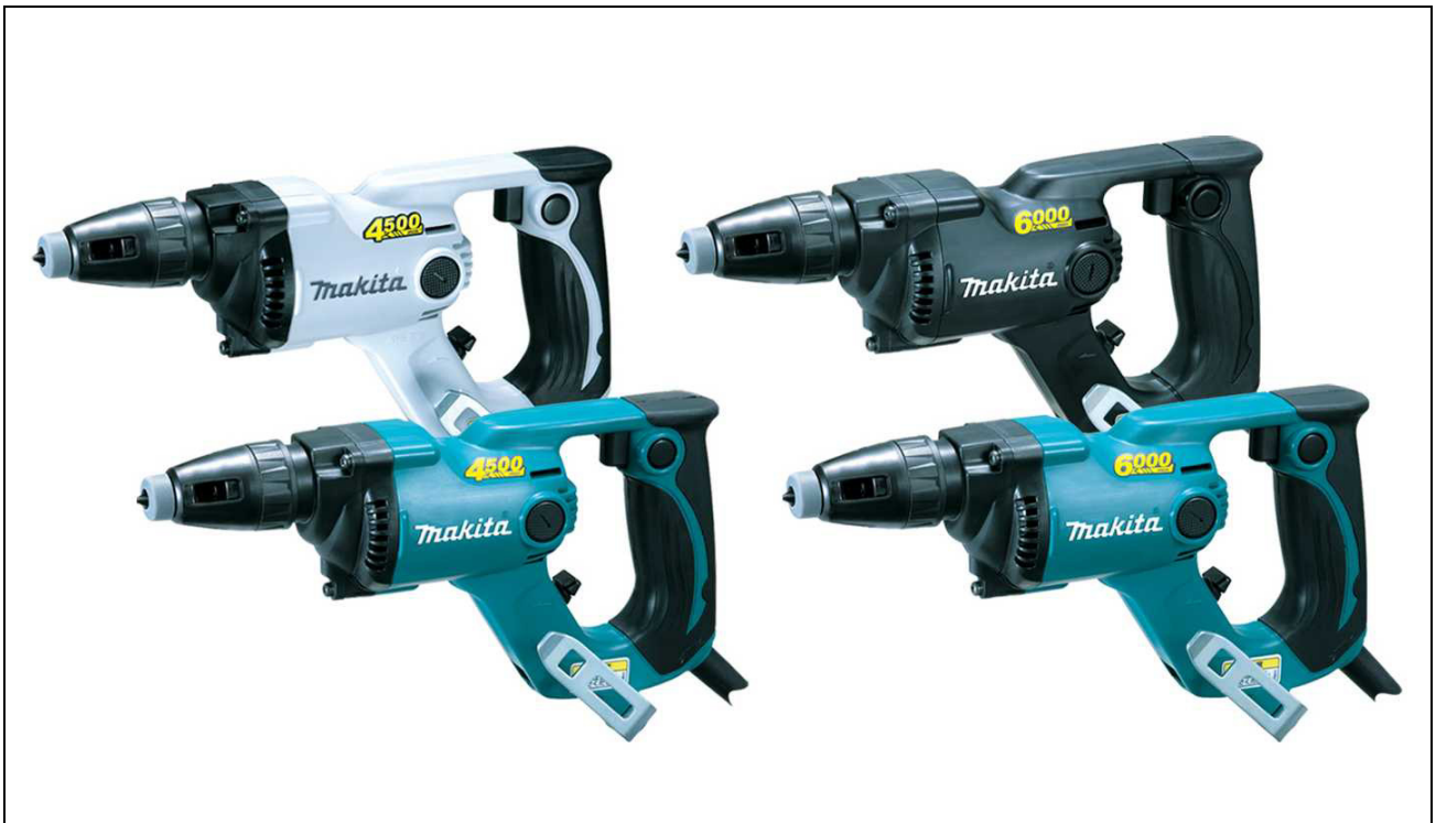
ボード用スクレュードライバ(左上から)6818SPW(白)／6819SPB(黒) 6818SP(青)／6819SP(青)