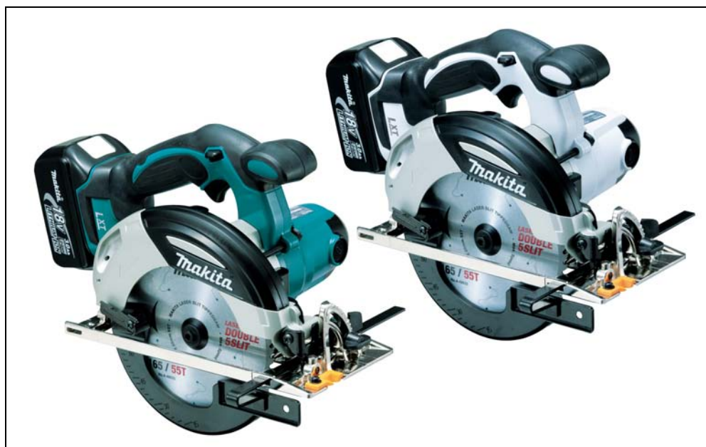
(左から) 165mm充電式マルノコ HS630DRFX、HS630DRFXW