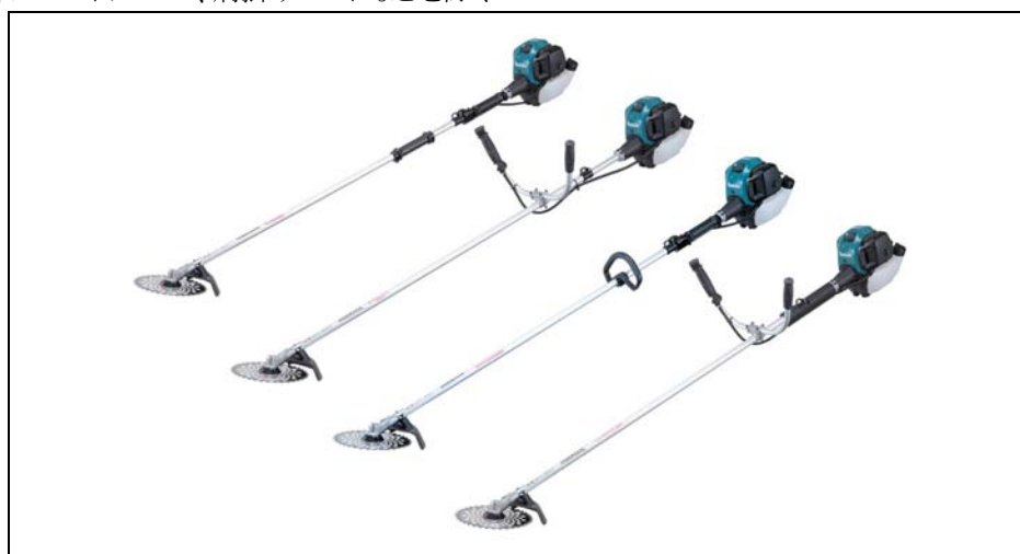
(左から)エンジン刈払機 MEM2650WH、MEM2650UH、MEM2651LH、MEM2651UH