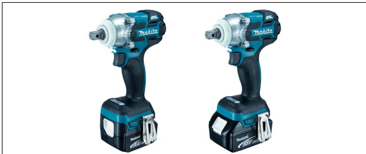
(左から)14.4V充電式インパクトレンチ TW280D、18V充電式インパクトレンチ TW281D