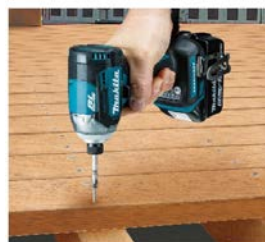
硬質材の長ビスに。