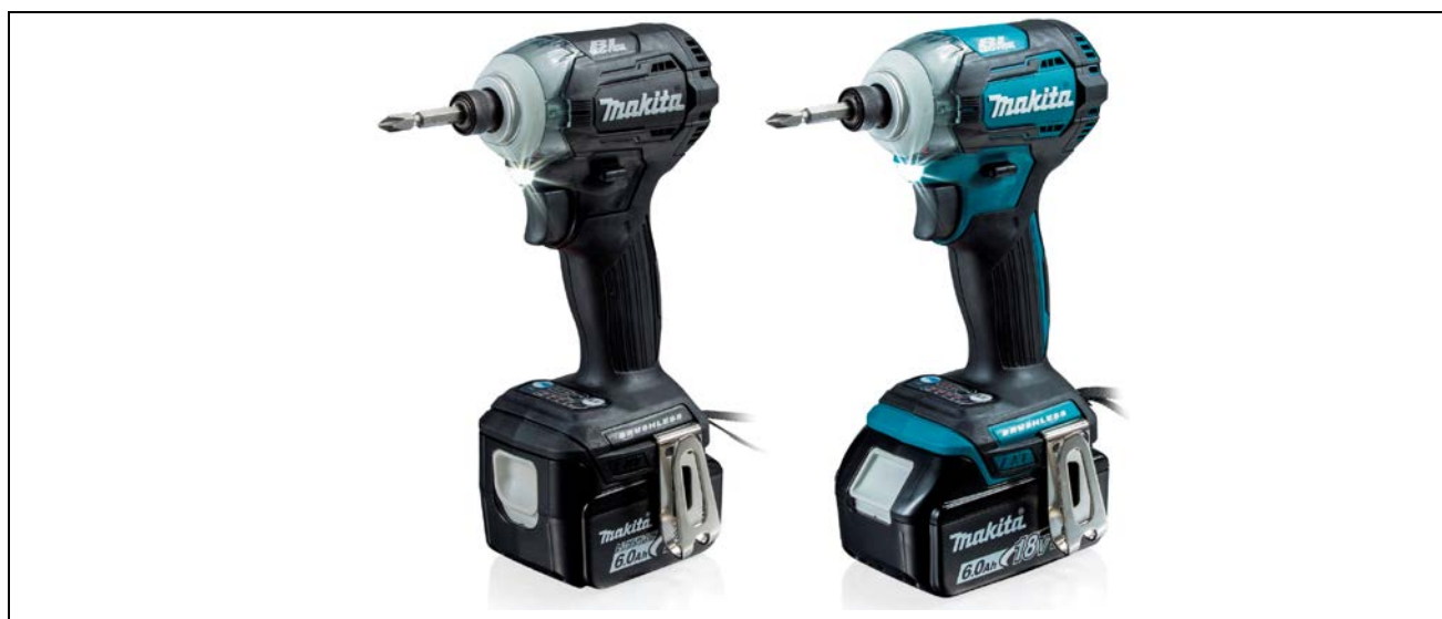
(左から) 14.4V充電式インパクトドライバ TD160D、18V充電式インパクトドライバ TD170D