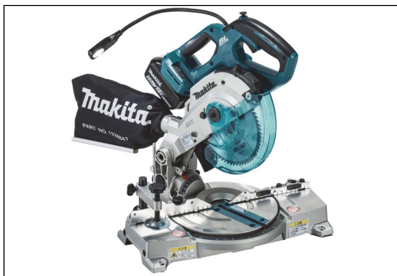
165mm充電式卓上マルノコ LS600D(ノコ刃別売)