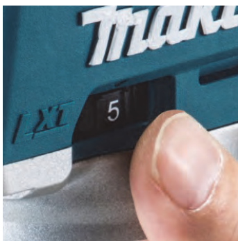
(1) 速度調整ダイヤル

作業内容に合わせて回転数を設定可能です。本機を握ったまま操作できる位置にダイヤルを配置しました。