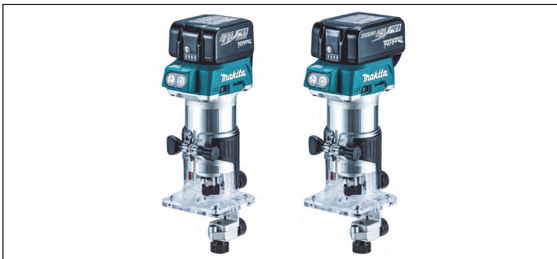
充電式トリマ 左から RT40D/RT50D

トリマは木材を削り加工する工具で、建具の製作・加工の他、棚やテーブルなど様々な家具の装飾などに使用される製品です。このたび発売するRT40D/RT50Dは、リチウムイオンバッテリーの採用に加えブラシレスモータ搭載により、コードレスならではの取り回しの良さとAC機を超える作業スピードの両立を実現しております。