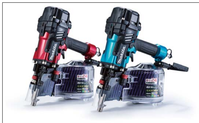
左: AN936H、右: AN936HM