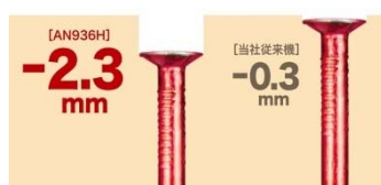
釘の沈み量比較(当社調べ)

従来モデルからボディ幅が7.4mm 細いコンパクトボディとしながらも、内部構造の改良によって打込み力を向上させており、さらに AN636H でも採用した全周スパイク形状かつスリムで耐摩耗性に優れる新・スパイクスリムノーズによって、狙った場所に対してより確実に、力強く打込むことができます。