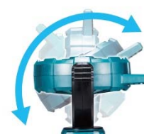
上下角度調整イメージ(手動)