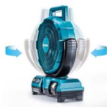
自動首振りイメージ

また、手動による上下135度の角度調整も可能で、サーキュレーターとして使用することもできます。