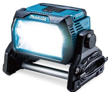
充電式スタンドライト ML809

株式会社マキタ(本社:愛知県安城市、取締役社長 後藤宗利、資本金24,206百万円)は、建設現場や道路工事等で使用する照明において、圧倒的な明るさ(10,000lm)を誇る「充電式スタンドライト ML809」を発売する運びとなりましたのでお知らせします。本機は当社充電式ライトシリーズの中で最も明るく、当社のリチウムイオンバッテリーのほか、家庭用100V電源でも使用できるスタンドライトです。