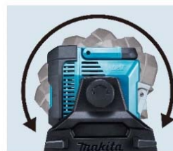
ライト角度調整 240°(無段階)