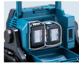
14.4V/18Vバッテリー2本装着可能 (14.4V+18Vの同時装着も可能)