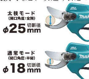
開口角度調整ボタン(右)

グリップ後方にある開口角度調整ボタンを押せば、最大切断径の切替ができます。通常モードはΦ18mm、太枝モードはΦ25mmで、作業に応じて簡単に調整ができます。また、切込み深さの調整機能により、刃物を研いだ後、交換時などに切込み深さの調整ができます。