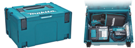
マックパックタイプ3 標準付属品 各種アイテムをまとめて収納可能 ※写真のバッテリー、充電器は別売です