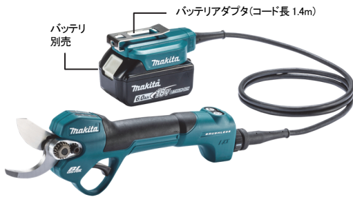
ホルスタ付 標準付属品