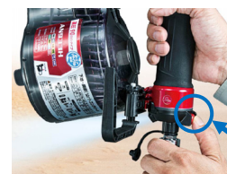
エアダスタボタン

作業現場の木屑やほこりの吹き飛ばしに便利なエアダスタを搭載しました。グリップ下部のエアダスタボタンを押せば、本体内部を経由しないクリーンなエアを、グリップ下部より噴射できます。