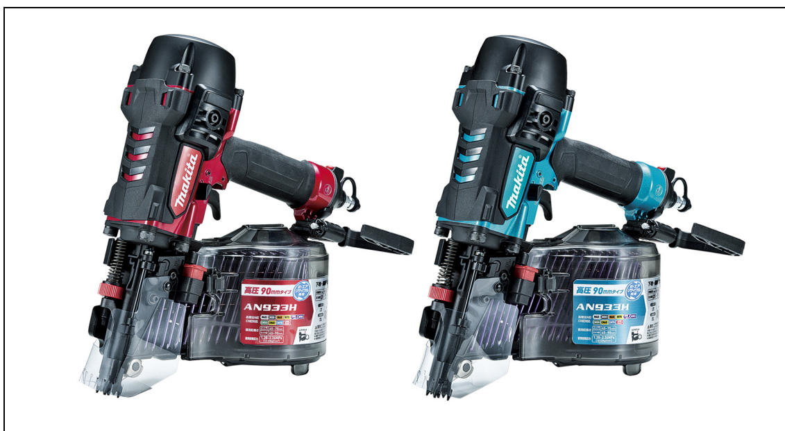
(左から)90mm高圧エア釘打 AN933H/AN933HM