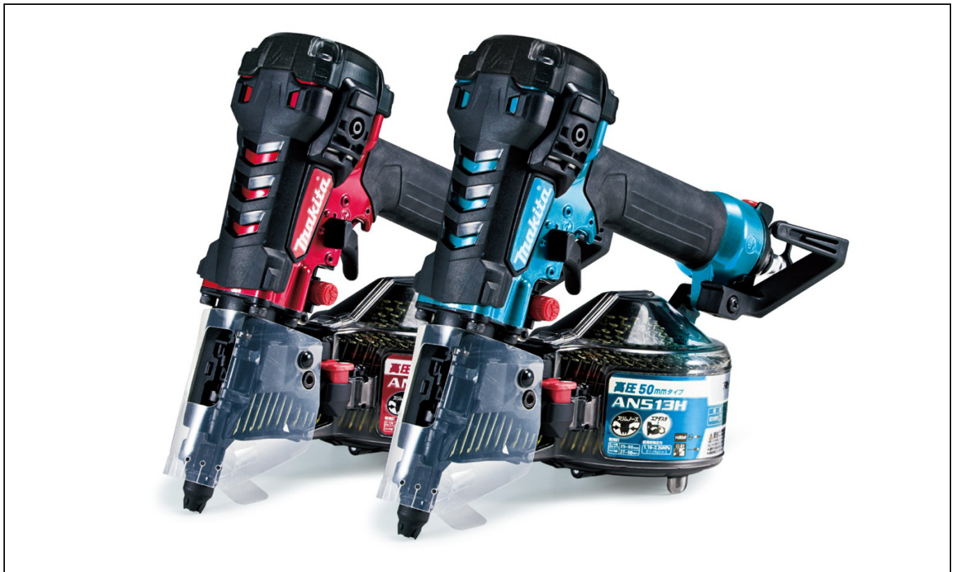
(左から)50mm高圧エア釘打 AN513H(赤)／AN513HM(青)