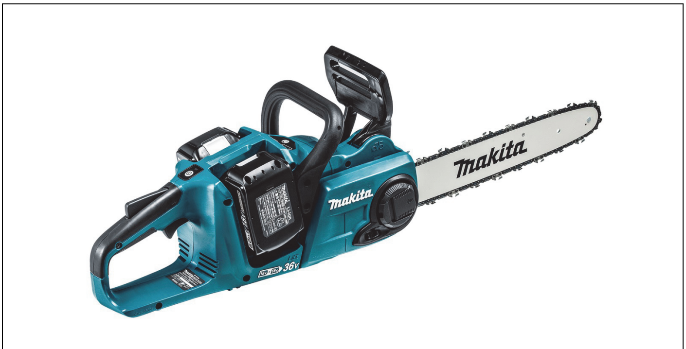
350mm充電式チェンソー MUC353D