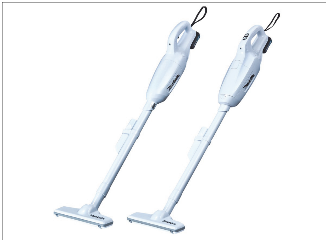
左から 充電式クリーナ CL106FD/CL107FD