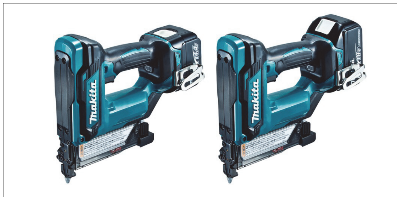
左から 充電式ピンタッカ PT352D/PT353D