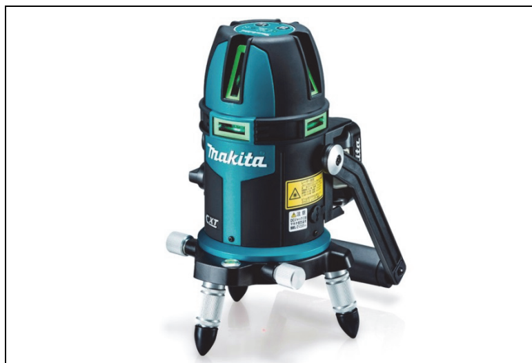
充電式屋内・屋外兼用墨出し器 SK505GDZ