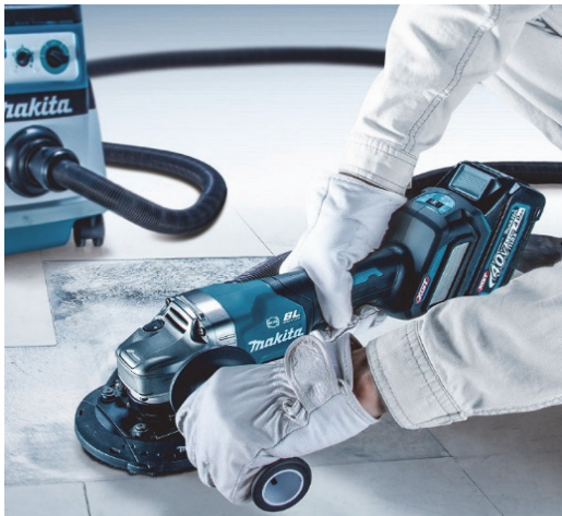
※写真のダイヤモンドホイール、集じんカバー、集じん機は別販売品です。

昨年 10 月の発売開始以降、充電式工具 40Vmax シリーズは、ハイパワー・長寿命・高耐久リチウムイオンバッテリー搭載モデルとして順次ラインアップを拡充しています。この度加わる「100 mm/125 mm充電式ディスクグラインダ」は、Bluetooth による集じん機との無線連動機能とともに、作業に応じて回転数を調節できるダイヤル変速機能を備え、切断はじめ研削・研磨など様々な作業現場における粉じん対策や作業効率の向上に貢献するモデルです。