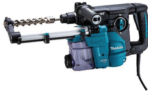
HR3011FCV (集じんシステム付)