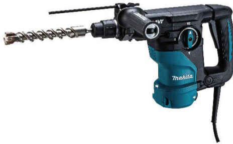
HR3011FC (集じんシステム別売)