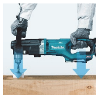
軸心を押しやすく 振り回されにくい

使用時に振り回されにくいように配慮された縦長ボディとハンドル位置、作業姿勢に合わせて角度を変更できるフロントハンドル、過負荷時にビットの回転を停止する(低速モードのみ)トルクリミッタ、IPX6 の防水保護等級※2(本体)など、ユーザーの使いやすさを考慮した様々な機能を充実させています。