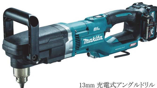
13mm 充電式アングルドリル DA001G