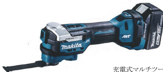
充電式マルチツール TM52D