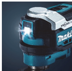
LED ライト(残照機能付き)

薄暗い現場で役に立つ LED ライトや工具レスでのブレード交換、防滴防じん技術「APT」※3の採用など、現場での使いやすさを考慮した機能を備えています。