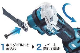
工具レスで簡単ブレード交換