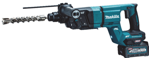
28mm 充電式ハンマドリル HR007G