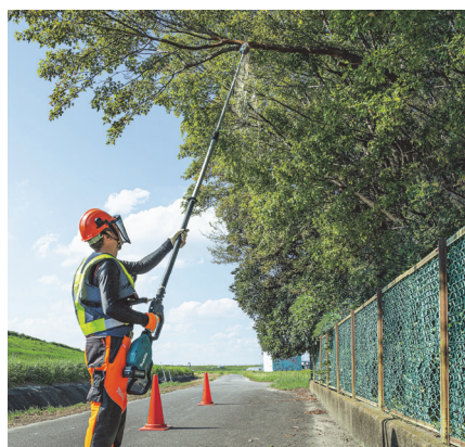
充電式高枝チェンソー MUA002G

株式会社マキタ(本社:愛知県安城市、取締役社長 後藤宗利、資本金 24,206 百万円)は、40Vmax リチウムイオンバッテリーを使用し、高所の枝払いをパワフルにこなす「 充電式高枝チェンソー MUA002G 」を発売する運びとなりましたのでお知らせします。このたび発売する MUA002G は、充電式でありながら 35mL エンジン式以上のハイパワーを実現し、最大高さ約 5m の高枝を軽快に切断します。