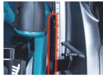
高剛性デプスガイド