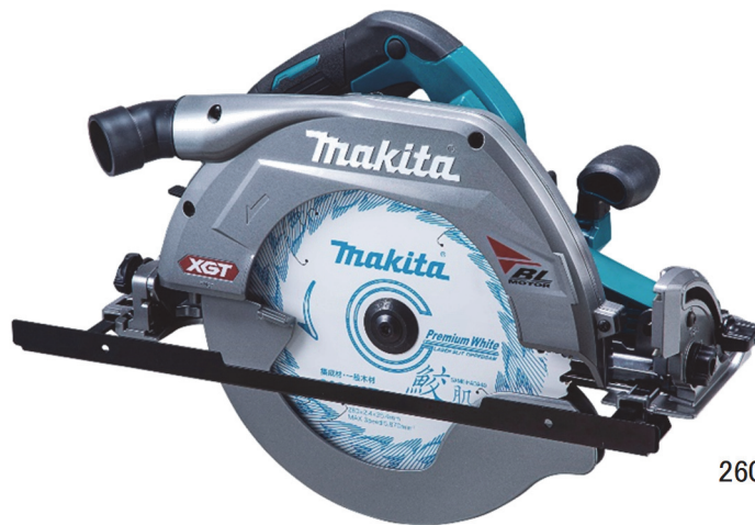
260mm 充電式マルノコ HS011G