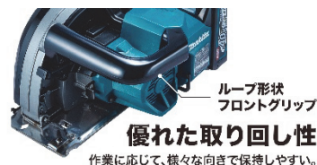
ループ形状 フロントグリップ 優れた取り回し性 作業に応じて、様々な向きで保持しやすい。