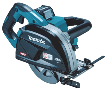
185mm 充電式チップソーカッタ CS001G