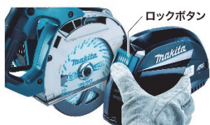
ダストケース簡単着脱 ロックボタンを押すだけで片手で着脱。

様々な向きで保持しやすいループ形状のフロントグリップ、ロックボタンを押すだけで片手で着脱できるダストケース、本体・バッテリーともに IP56 の防じん防水保護等級※3など、ユーザーの使いやすさを考慮した機能が充実しています。