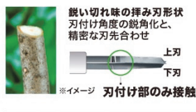
鋭い切れ味の挿み刃形状 刃付け角度の鋭角化と、精密な刃先合わせ