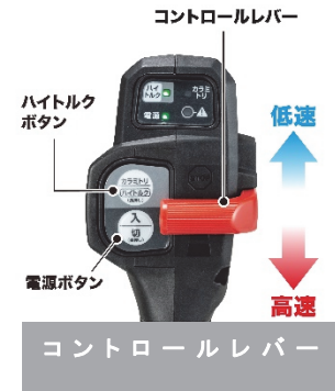
コントロールレバー