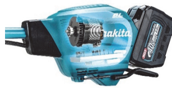
後端モータで最適重心バランス

また、コントロールレバー式の数値調整を採用しており、レバーで任意の速度に調整することができ、エンジン式と同じ操作性を実現しています。