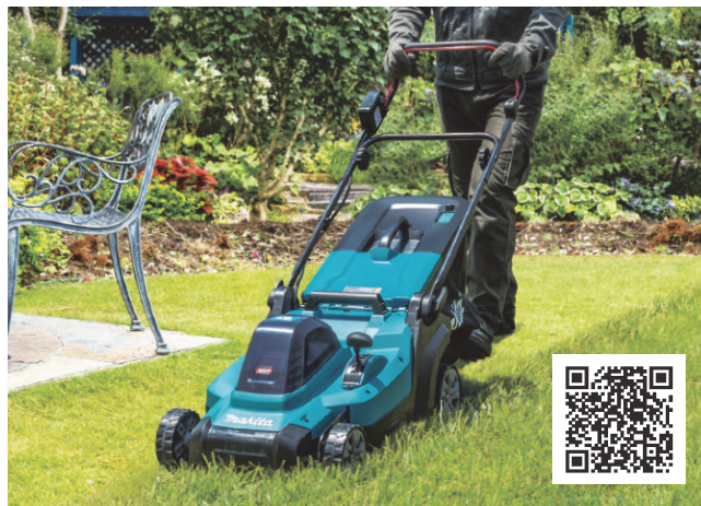
MLM003G/004G の動画が ご覧になれます。

このたび発売する「MLM003G」は刈込幅が 380mm、「MLM004G」は刈込幅が 430mm で、緑地管理から一般宅の芝刈りまで幅広く対応する充電式芝刈機です。40Vmax リチウムイオンバッテリー 1 個で使用可能、軽量かつコンパクトなボディが特長です。スイッチレバーや刈込み高さ調整レバーの操作性をアップさせ、使いやすさを追求しました。